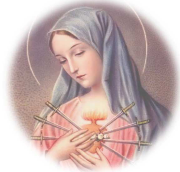
[Our Lady of Sorrows]

Holy Mary, Our Lady of Sorrows: hear the cries of innocent children taken from their mothers' wombs and pray for us sinners now, and at the hour of our death. Amen