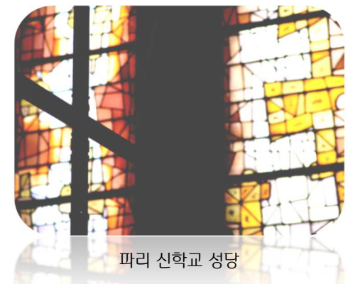
파리 신학교 성당